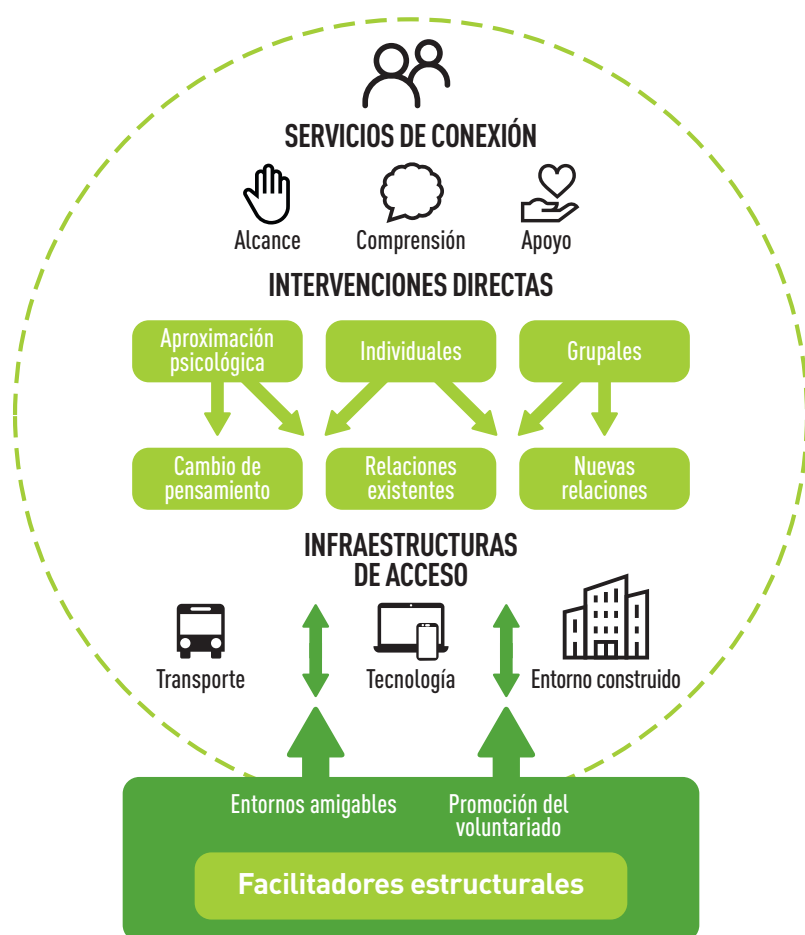
Gráfico 2: Marco de clasificación propuesto por Jopling (2020)